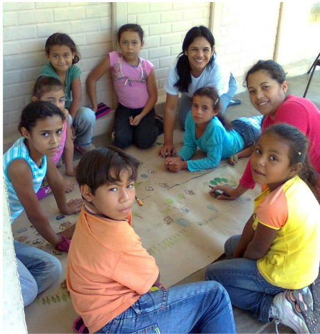
FIGURA 2. Atividade pedagógica com as crianças sobre a elaboração do mapa social da comunidade.