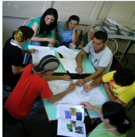
FIGURA 3. Atividade Pedagógica com os membros da Comunidade Rural de São Joãozinho sobre o lugar que vivem.